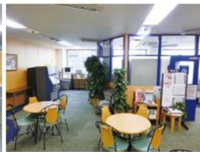
ラウンジ (約144平方メートル) ・テーブル(個数:4個)・椅子(個数:20脚) ・50インチ液晶テレビ・DVDプレイヤー