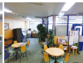
ラウンジ (約144平方メートル) ・テーブル個数: 4個・椅子個数: 20脚 ・50インチ液晶テレビ・DVDプレイヤー