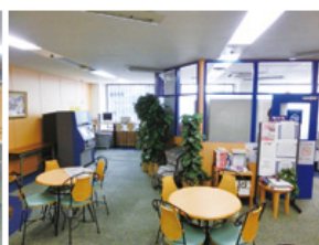
ラウンジ (約144平方メートル) ・テーブル個数: 4個 ・椅子個数: 20脚 ・50インチ液晶テレビ ・DVDプレイヤー