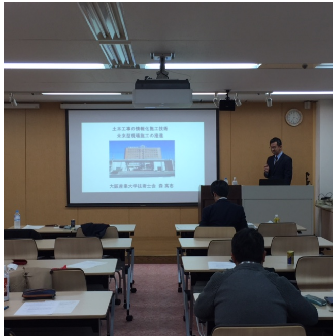
森 講師による講演の様子